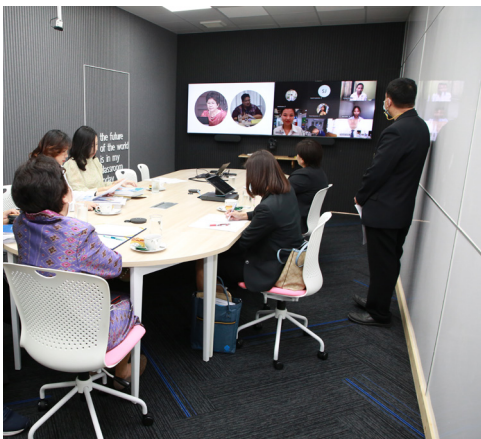
• ห้อง Online Learning Room

การทำให้เกิดความเข้มแข็งของหลักสูตรนั้น มหาวิทยาลัยได้นำแนวคิดการศึกษาที่มุ่งเน้นผลลัพธ์การเรียนรู้ หรือ Outcome-Based Education (OBE) มาปรับใช้เป็นแกนกลางของการพัฒนาหลักสูตรที่ให้อิสระต่อผู้เรียนตั้งแต่การออกแบบกระบวนการเรียนรู้จนถึงการประมวลผลการเรียนรู้ การสร้างชิ้นงานและนำเสนอผ่านสื่อดิจิทัลได้อย่างทันสมัย โดยมีผู้สอนเป็นผู้กระตุ้นและแนะนำ ปรับรูปแบบการเรียนรู้ใหม่ให้สอดคล้องความต้องการของผู้เรียนตามผลลัพธ์การเรียนรู้ที่คาดหวัง และพัฒนาทักษะของผู้เรียนให้ตรงกับความต้องการของตลาดแรงงาน เพื่อเป็นทรัพยากรมนุษย์ที่มีคุณภาพของประเทศ เน้นการเรียนรู้แบบ Active Learning เพื่อให้ผู้เรียนสามารถเชื่อมโยงองค์ความรู้และทักษะต่าง ๆ ผ่านกิจกรรม มีความเข้าใจได้อย่างถ่องแท้และสามารถปฏิบัติงานได้จริง รวมทั้งพัฒนาหลักสูตรใหม่แบบบูรณาการศาสตร์ทั้งระยะสั้นและระยะยาวกว่า 10 หลักสูตร บูรณาการภาษาอังกฤษในหลักสูตรเพื่อยกระดับความเป็นสากลให้กับผู้เรียน เช่น หลักสูตรศิลปศาสตรบัณฑิต สาขาวิชาธุรกิจการบิน หลักสูตรบริหารธุรกิจบัณฑิต สาขาวิชาธุรกิจระหว่างประเทศ ธุรกิจจีน – เอเชีย หลักสูตรศึกษาศาสตรบัณฑิตสาขาวิชาการศึกษาศาสตร์และสาขาวิชาการประถมศึกษา ตลอดจนยกระดับศักยภาพการสอนของบุคลากรสายวิชาการให้สามารถสอนในรูปแบบ Hybrid Teaching ได้อย่างมีประสิทธิภาพภายใต้แนวคิด Teach Less & Learn More และ Interactive Learning : Play & Learn